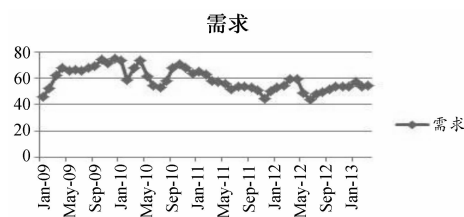
图 1 中国制造业的需求

本文选用 PMI 的某些分项指标作为中国制造业整体需求情况的分析指标,选取自 2009 年 1 月份以来的各项数据进行分析。这些指标包括采购量指数、产成品库存指数和新订单指数。我们将每个月的三个指标整合成一个需求指标,具体整合方法是,用新订单指数与采购量指数相加,然后减去产品库存量指数。结果如图 1 所示。