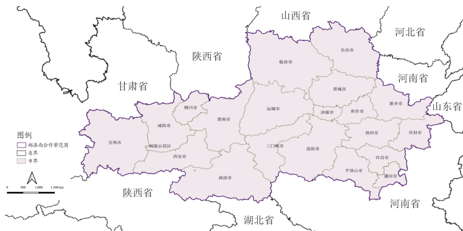
图1 郑洛西(晋陕豫)高质量发展合作带空间范围

郑洛西(晋陕豫)高质量发展合作带位于黄河流域,地处河南(豫)、陕西(陕)、山西(晋)三省交界区。为了研究需要,本文提出的郑洛西(晋陕豫)高质量发展合作带范围暂定包括河南省郑州市、开封市、洛阳市、新乡市、焦作市、许昌市、三门峡市、平顶山市、漯河市、济源市(省直辖县级行政单位)等10市,陕西省西安市、宝鸡市、咸阳市、铜川市、渭南市、商洛市等6市和杨凌农业高新技术产业示范区1区,山西省临汾市、运城市、长治市、晋城市等4市,共计20市1区(见图1)。郑洛西(晋陕豫)高质量发展合作带地域面积20.2万平方公里,2020年地区生产总值5.82万亿元,年末常住人口9079.4万人。其中,豫、陕、晋三地地域面积占比34.3:37.0:28.7,常住人口占比53.7:30.7:15.6,地区生产总值占比58.9:30.3:10.8。