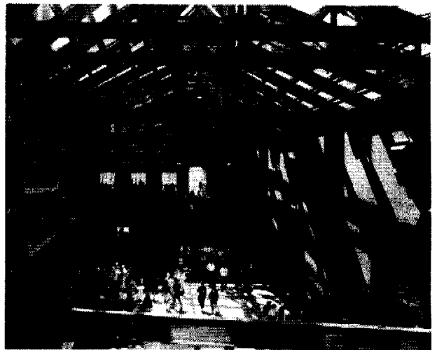
图 3 华盛顿大毒杀纪念馆见证厅

者。见证厅是纪念馆的核心部分,粗糙的红砖墙面,上面用角钢和铆钉固定了各类支撑构件,硕大粗重的钢屋架与玻璃组成了屋顶,阳光透过玻璃,把钢屋架的影子折裂变形,不规则的印在大厅的墙面与地面。四周墙面较高部位均布着一些通风百叶窗,从百叶后面射下了隐秘的探射灯光,好像暗示着当年从中喷出的滚滚毒气。杂乱的光影,扭曲的构图,冰冷的材质构成了一种不安定的气氛。仿佛回到了那惨绝人寰的历史之中。顶层的砖塔是唯一顶部自然采光的展示,沿着塔内通高的四壁,满满的悬挂着无以计数的亡者的相片,男女老幼,重叠模糊,好像要从四面八方扑面而来,或沿着塔顶射入的阳光升腾而去。