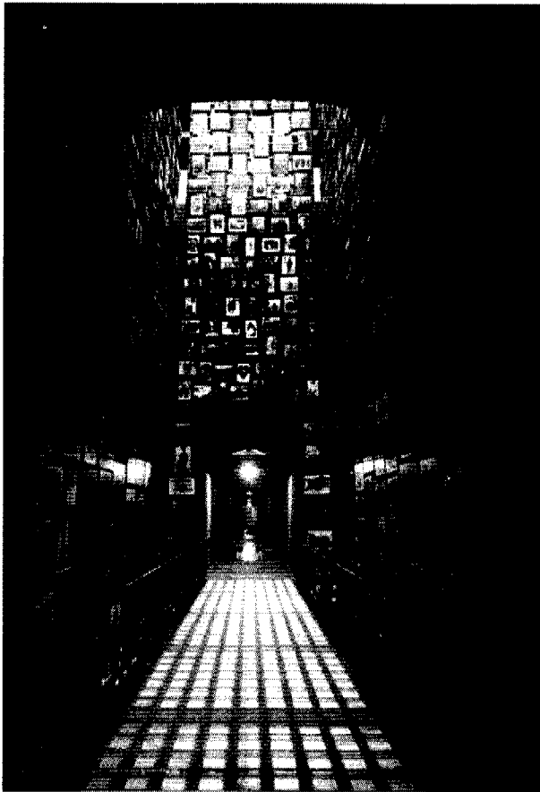
图4 华盛顿大毒杀纪念馆顶层展厅

一旦进入博物馆则变成了静止不动的死物。让展品动起来,以其自然存在状态展示在观众面前,这不仅能增强展览的趣味性和娱乐性,而且更能使观众得到真实地感受。在日本的神井恐龙博物馆(图5),观众一进入展览大厅,仿佛一下子进入距今六千五百多万年至两亿年以前的恐龙世界。各式各样的恐龙在大厅中徘徊,并不时地发出使人毛骨悚然的叫声。那五颜六色的皮肤,千奇百怪的相貌,神气活现的姿态以其大厅四周不止的恐龙时代的植物和其他的自然景观都给观众留下不可磨灭的印象。这些恐龙都是由电脑控制的机械恐龙,但它有真实恐龙化石无法替代的展出效果。