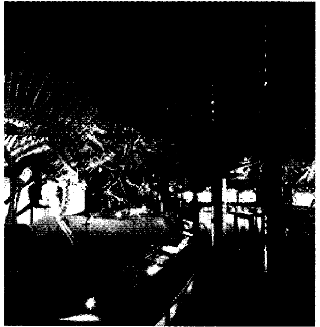
图 2 某博物馆的陈列大厅

现代博物馆陈列方式的另一个改变是由注重孤立的展品发展为注意展品及其背景环境。一件展品一旦被移入博物馆的展柜,就失去了它的大部分意义,一套不同的价值观念就开始发生作用,这不仅容易造成博物馆陈列的单调乏味,而且容易造成观众对展品理解上的困难。许多博物馆开始把展品置于一定的背景中来展示,使他的信息价值得到充分体现。这种陈列模式可以是一个景箱,也可以是一间精心布置的展厅,甚至一个大的室外展场。他留给观众一种身临其境的感受。从某种意义上说,观众需要的是感官上的满足而不是智力上的。以华盛顿大毒杀纪念馆(图 3,图 4)为例,用以悼念二战时死于法西斯大毒杀的所有牺牲