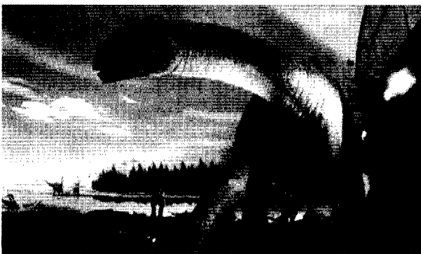
图5 日本的神井恐龙博物馆

一旦进入博物馆则变成了静止不动的死物。让展品动起来,以其自然存在状态展示在观众面前,这不仅能增强展览的趣味性和娱乐性,而且更能使观众得到真实地感受。在日本的神井恐龙博物馆(图5),观众一进入展览大厅,仿佛一下子进入距今六千五百多万年至两亿年以前的恐龙世界。各式各样的恐龙在大厅中徘徊,并不时地发出使人毛骨悚然的叫声。那五颜六色的皮肤,千奇百怪的相貌,神气活现的姿态以其大厅四周不止的恐龙时代的植物和其他的自然景观都给观众留下不可磨灭的印象。这些恐龙都是由电脑控制的机械恐龙,但它有真实恐龙化石无法替代的展出效果。