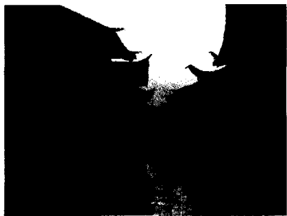
图5 远离四方街的清晨丽江

后,旅游业快速兴起,古城内的原住民因于经济利益的驱动大量外迁,大量的外来经商人口涌入古城。居民的改变带来了社会生活网络的改变,最终也将对原有的丽江文化带来巨大的改变。原有民居的合院型制也由于追逐临街的经济效益受到了严重的破坏,原本集居住、商贸、游览于一体的历史街区,渐渐变成了纯粹的商贸旅游区,丧失了其原有的历史真实性(图5、6、7)。