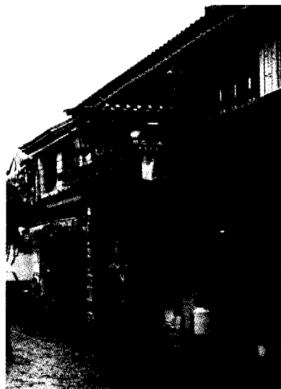
图8 整修后的大理大街建筑