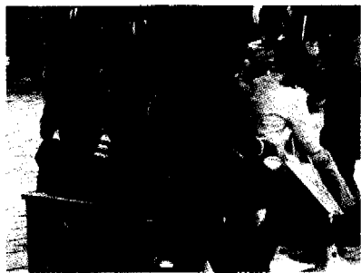
图7 四方街上少见的纳西老人