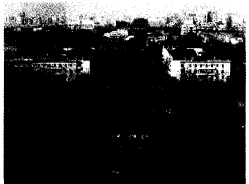
图3 从景山看到的北京

拆了,北京依旧围绕老城摊大饼的发展(图3、4)。当今天的北京制定新的城市总体规划,强调市区不再扩大规模,城市建设的重点从市区转移到广大郊区,强化在市区外围建设卫星城的部署的时候,我们很难不感慨万千,而这种事例在我们全国的城市建设中更是比比皆是。在这个过程中我们付出了沉重的代价,希望这些代价最后的价值是成为我们永远的城市建设的警笛。