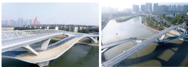
图 11 成都五岔子大桥

成都的“网红”五岔子桥(如图 11 所示)是国内首座“莫比乌斯环”式异形拱桥,其独特的设计理念和建成后惊艳的造型,引起业内外的一致赞誉。