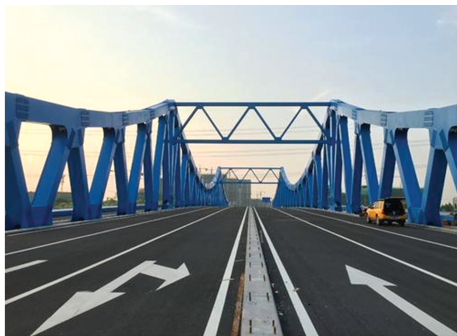
图 6 杭州湾滨海大道桥

作为杭州湾新区重要的景观桥梁(如图 6 所示),滨海大道桥采用(62+100+62) m 三跨连续钢桁架梁桥,采用两片主桁结构,桁架高度按二次抛物线变化,桥道系采用纵横梁体系。该桥结构轻盈简洁、通透柔美,与新区的滨海湿地景观相协调,陈强等 [41] 对杭州湾新区滨海大道桥总体设计进行了总结,可为同类型桥梁的建设提供参考。