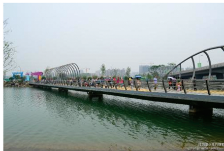
图 8 长沙梅溪湖节庆岛浮桥

曾令权等 [46] 对长沙梅溪湖节庆岛浮桥(如图 8 所示)结构设计进行了总结。为减少传统桥梁施工方法对景区湖泊的污染,长沙梅溪湖节庆岛人行桥采用由 FRP 浮箱、钢纵横梁桥面系、混凝土定位桩组成的浮桥结构体系,通过理论计算、构造细节设计、开通运行等验证了浮桥结构的可靠性。结果表明:1)浮桥结构所有杆件工厂批量加工、现场组拼,施工效率高、污染小;2)该浮桥结构的安全性、舒适性能满足人行结构要求;3)该结构体系在内湖景区人行通道建设上,具有较好推广价值。