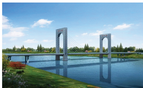
图 5 宝鸡市阳平大桥

宝鸡市阳平大桥(如图 5 所示)主桥为(102+208+102)m 格构式钢塔斜拉桥。刘鹏等 [40] 对设计过程进行了详细介绍。根据景观需要,桥塔设计为格构式钢塔(分为下塔柱、上塔柱和塔顶横梁三部分),除下塔柱为钢筋混凝土结构外,其余均为钢结构,基础采用群桩基础。主梁采用分离式双边箱钢结构,斜拉索采用 1 860 MPa 环氧涂层钢绞线,斜拉索在梁端采用双锚腹板式斜拉索锚固系统,在塔端采用固结钢锚梁式斜拉索锚固系统。桥梁位于高烈度区,主桥采用双曲面摩擦摆球型减隔震支座,桥塔位置设置纵向粘滞阻尼器,并在桥塔与主梁相交处设置竖向板式支座进行纵、横向限