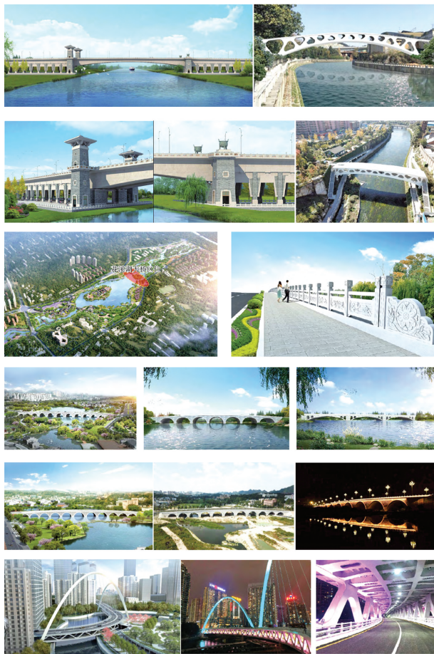
图 3 淮南市楚都大道桥梁规划设计部分效果图 [33]

胡辛 [33] 就淮南市楚都大道总体设计(如图 3 所示)进行了总结。淮南市楚都大道为城市主干路,道路上跨滨湖大道、与寿县保庄圩大堤平交,跨越东淝河、施家湖,与唐山镇保庄圩平交,下穿合淮阜高速公路。道路的平面线形按照规划线位并结合东淝河大桥的桥位进行优化,道路纵断面根据城区排涝水位、东淝河通航水位,并结合两侧现状道路高程进行设计,道路横断面根据道路功能定位,通过交通量预测结果进行优化。结合当地的楚汉文化特色,对东淝河大桥进行景观设计,以楚汉阙楼与楚鼎景台为桥头建筑,增加桥头观景平台、上下梯梯及桥下文化休闲场地,使桥梁装饰与功能充分结合。