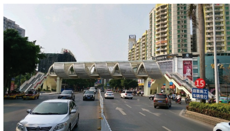
图 1 湛江世贸人行天桥