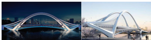
图 9 寿光市金光街跨弥河大桥

以针对寿光市金光街跨弥河大桥(如图 9 所示)为例,杨乐杰 [47] 通过对周边环境、设计条件及桥梁景观定位分析,提出了景观设计方案及中承式系杆拱桥结构方案。由于平行无支撑拱桥梁稳定性较差,故采用有限元软件对结构体系进行分析,提出了较为新颖的连续梁与中承式拱组合的新型结构体系,有效降低拱轴内力,增强拱肋稳定性,从而提高桥面系结构整体性。这可为后续同类桥梁设计提供借鉴。