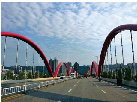
图 7 长州市神农湖大桥

黄韬 [43] 以长州市神农湖大桥(如图 7 所示)为背景,分析了异形桥塔造型的结构实现方案,对该桥的结构体系进行了研究,并分析了塔墩梁固结体系的独塔斜拉桥建模要点及其在地震作用下的动力响应,为类似工程提供有益参考。