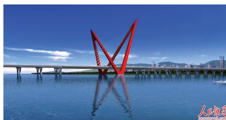
图 4 六安市寿春西路景观斜拉桥

屈计划 [39] 对非对称四_V_景观斜拉桥构思及设计进行了很好的总结。寿春西路景观斜拉桥(如图 4 所示)为六安市地标性建筑,桥梁设计时基于六安市“桥群”理念进行桥梁造型设计,注重桥梁自身的建筑造型,立足景观要求,做到“一桥一景、亦桥亦景”。主桥采用四“V”斜塔不对称斜拉桥,塔肢纵向“V”字形,横向“ \Delta ”字形,钢-混主梁,整体结构构思巧妙、造型新颖、不同视角均有较强空间效应。