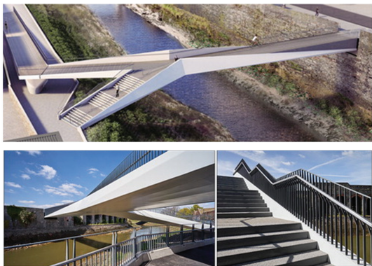
图 10 圣飞利浦人行天桥

1840 年,连接伦敦和布里斯托尔的英格兰南部大西部铁路的落成典礼,将布里斯托尔郊区的一部分改为主要的铁路枢纽所在地。雅芳河和巴斯路之间的车站后方区域,被称为圣殿岛,被限制使用铁路(车间,仓库和棚屋)已有 150 多年的历史。随着铁路使用的减少,铁路变得越来越无吸引力。该地区向中心新街区的改造是布里斯托尔目前计划中最重要的城市发展项目之一。Beade-Pereda 等 [49] 对新的人行天桥的设计进行了介绍。新的圣飞利浦人行天桥(如图 10 所示)横跨 Avon 河,为该站点的无障碍提供了便利。这座桥具有 50 m 跨度和 4 m 宽的钢梁,具有叉形几何形状,无缝地为残疾人和骑自行车的人提供了坡道,并设有楼梯以最大限度地发挥功能。其设计满足结构、美学和功能上的要求,并创新地解决了复杂的交叉问题。