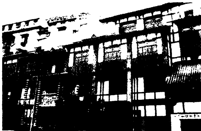
图 1 改造示范段

针对川道拐、文觉寺片区的改造我们本着正确处理这一片区传统风貌保护与现代化发展关系的原则,充分挖掘其历史文化和内涵,保护和强化其历史风貌,增加旧社区活力,从实质环境改善、社会环境改善、居民需求以及历史风貌特色保护等各个方面进行综合的具有针对性的保护与更新改造。具体思路如下: