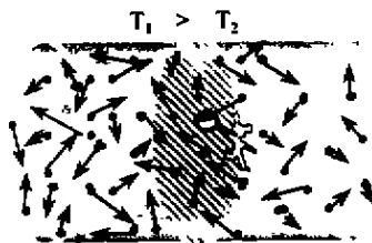
图1 “麦克斯韦妖”设想

“麦克斯韦妖”设想的更重要的意义是揭示了熵与信息的联系。如果换一个角度来看,有足够多的分子,“麦克斯韦妖”这个小生物在控制高速分子流入高温侧中,必须得到分子速率大小的信息,不论是视觉接受光能信息,还是听觉接受声能信号,都有不可逆过程出现,也就是产生了“其它影响”,所以并不与热力学第二定律矛盾,由此还可以看出“麦克斯韦妖”得到信息后,使快慢分子分离,系统更加有序,导致系统的熵减少,所以说信息就是负熵。当然“麦克斯韦妖”的设想应该是个可以从外界引入负熵的开放系统,热力学第二定律熵增加原理是针对孤立系统的,也就无矛盾可言了,值得注意的是信息可以看作负熵的结论。也由此引发了科学家在信息论中参照热力学的熵,来讨论信息熵和信息量的关系,对于开放系统可以用引入负熵(信息)流使系统熵减少,而变得更有序,这是开放系统耗散结构的有序自组织现象 [2] 。