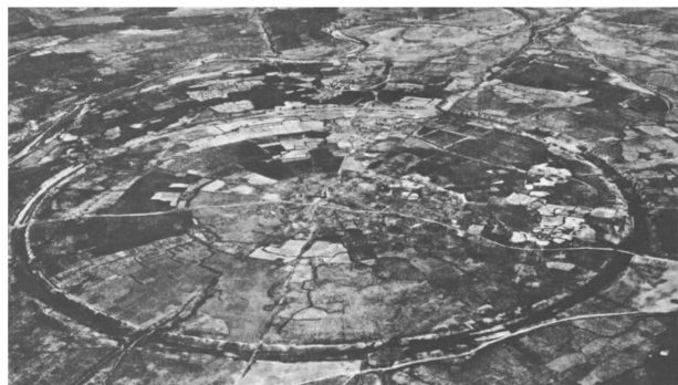
图7 伊朗:萨珊王朝的首都古阿伊

的,仪礼体现出规则性,这与仪礼的主要目的是建立社会秩序与规则相一致。仪礼作为内在文化观念的表现,它是保持社会结构的一种方式,这也就是它的社会功效。与仪礼相对而言,节日庆典的精神则是审美性的。同样作为与日常生活不同的社会集合活动,节庆的目的不在于强化社会等级秩序而恰恰在于消弭这种关系,在节庆的狂欢中社会成员重新回到家庭般的融合中来。因此,节庆与仪礼的落脚点大不相同。节庆和艺术一样,其目的是要消除主体的外在性,其普遍性的真理存在各个主体自由的本质当中。仪礼和文化则互为表里,其真理始终在于社会的集合性,对直接的主体是某种相对外在的东西。从理想城市衍生出来的美学,在静态上,体现为宇宙象征主义的城市形态;在动态上,表现为民俗节庆,此时聚落保护“神”作为各种主、客体关系的统摄,降临于人间与民同乐。此二者都结合于城市作为一个社会聚落整体的神话意象。