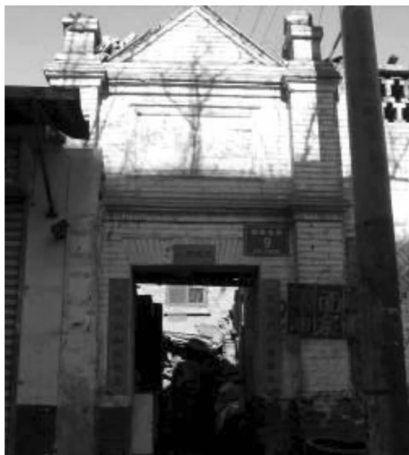
图6 住宅大门形式二 (坝陵北街9号院大门)

个别大门受外来文化影响,改建为西方山花、柱式形状(见图6)或“巴洛克”形式。大门正对东厢房山墙,山墙上建影壁,俗称照壁,用方砖斜角平砌(见图7),砖雕四边,照壁四角有砖浮雕图案,以蝙蝠纹样为常见,谐音“福”意。比较讲究的,整个影壁都雕满吉祥花鸟图案。大门面对影壁,不能直视院内,可以保证住宅院落的私密性。