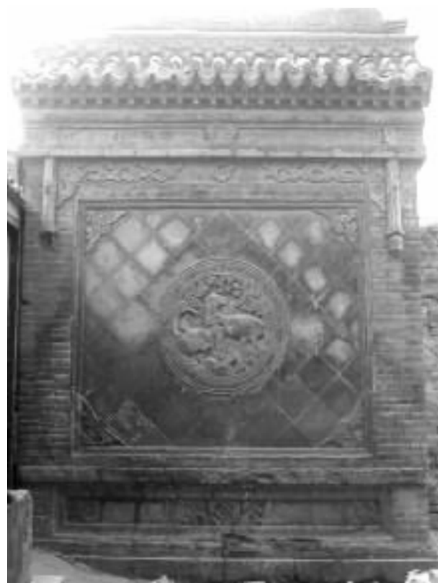
图7 照壁形式 (上三桥街8号院)

门楼是住宅装饰的重点,两侧砖墙上方多嵌有莲花、仙鹤等吉祥花鸟图案砖雕,大门上装有兽环,以圆钹形铺首衔环为多见,也有虎头形者,既做装饰,又有避邪之用。