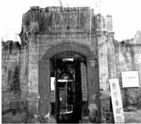
图5 住宅大门形式一 (精营西边街22号院大门)

太原四合院一般对大门比较重视,是装饰的重点。过街门道高于街面,大部分为瓦顶通道或门楼,称“如意门”。也有一部分大门形制稍简,不做屋顶,顶部稍加装饰,或开券式门洞(见图5)。