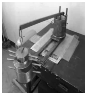
图2 饱和重塑土制样器

创新科研实验往往没有现成的设备,需要动脑、动手去设计,本课程群教师激发学生的主动性与创造性,指导学生设计、改进实验装置,对现有设备进行开发,饱和重塑土制样器(见图2)挡墙后主动和被动土压力测定实验方案设计(见图3)就是在教师指导下由学生研发制作的。目前学生参与设计的实验装置已申请国家发明专利5项。