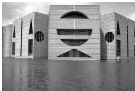
图3 孟加拉国达卡国民议会厅