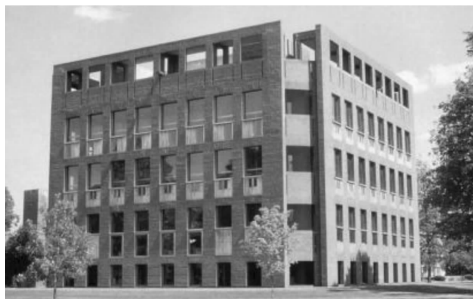
图2 菲利普埃克塞特学院图书馆