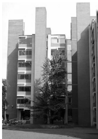
图1 理查德医学研究中心

大学理查德医学研究中心(图1),索克大学研究所、新罕布什尔埃克塞特菲利普埃克塞特学院图书馆(图2),孟加拉国达卡国民议会厅(图3),印度管理学院等。