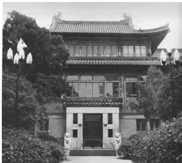
图4 金陵大学图书馆

例适当,不夸张不炫耀,如金陵大学图书馆(图4)、中山陵音乐台(图5)、宋子文公馆(图6)等。