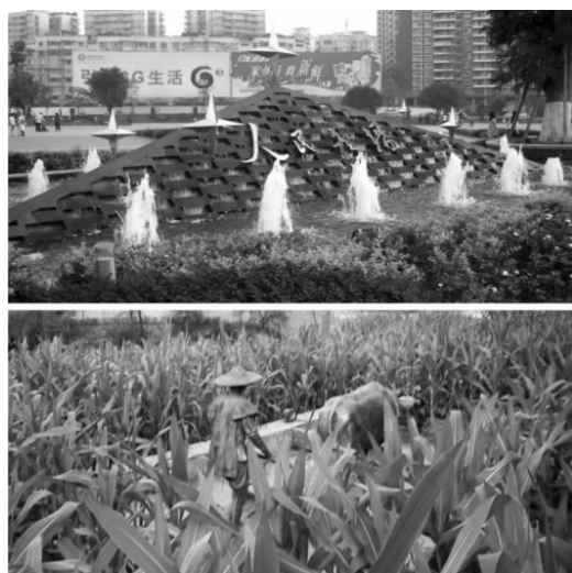
图4 “巴山蜀水”的文化体现

(现状建筑良莠不齐,其中存在三四层的中低层居民居住点,也有九层新建的中产阶级小区,还有象征权力制高点的市政大楼。)