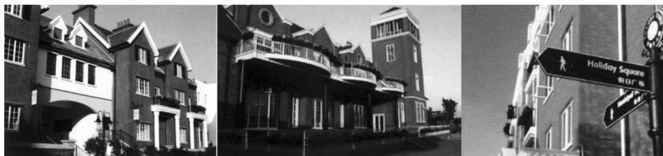
图2 松江新城的“泰晤士小镇”

在越大越好的心理驱使下,各种最长、最宽、最高、最美的政府项目接连不断审批立项,这一波波城市美化运动无疑加重了城市空间分异:超级尺度和视觉奇观引发城市空间外生分异;舶来风格和精英审美催化城市空间内生分异(图2)。