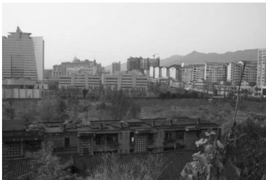
图3 建设前场地现状

该案主要突出“巴山蜀水”的地界特性。方案中将整个广场景观规划中用山、水作为组织元素,灵活穿插地块之中,连结缝合起原有的城市空间格局(图4)。山为石组成,古代蜀人有崇拜大石、崖石的原始宗教意识,因此以石头的形象为原型设计了南广场的标志性建筑。在其他方面,与传统的规则式设计相对应,通过植物群落设计和地形起伏处理,从形式上表现自然,立足于将自然引入城市的人工环境。利用各个大小不同、有主有次的节点构成而不是长、宽、大的城市景观设计,加深感知性和记忆性。