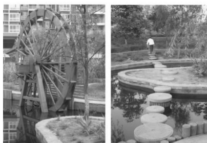
图6 多样性的互动景观

政府建筑群隔路相对的半圆形场地,是城市规划中预留出来作为公众集散和城市庆典的硬质广场。通过间隔绿化配套休憩设施的方式,把规划中广大完整的硬质铺地进行弱化,虽然从图形上依然可以保证其“形”其“量”,但在空间尺度和心理距离上却大大减小,提供更多的市民可参与空间(图5)。