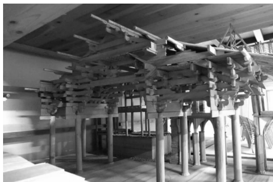
图1 大一学生所做的建构模型

自2008年起,每年的5月底,建筑学院都会举行一届建造节,每组参赛学生经过8小时辛苦、紧张、快乐地建造,用纸板搭建风格各异房子,并在里面居住一晚,真实体验了自己建造的空间,领会、把握了建筑最基本的要素——适用、经济、美观。这样的教学活动在激发学生创新兴趣的同时,也提高了学生对空间架构的认识,锻炼了实际操作能力。