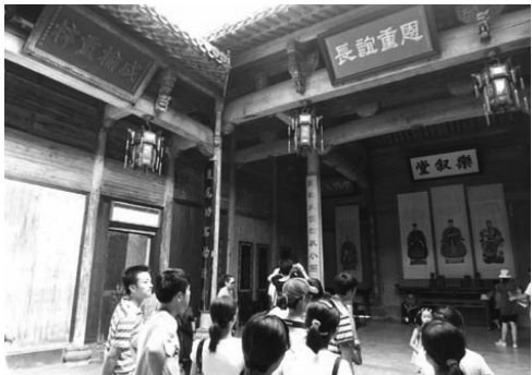
图4 宏村古建筑考察调研

教学之间的配合与互动,将课程教学有机融合于建筑调研实习、建筑测绘实习、素描与色彩实习等实践环节。学生能够借助相关课程的学习机会,以体验、考察的方式加深对建筑历史知识的理解(图4)。