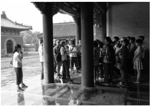
图1 清永陵建筑参观讲解

其次,充分利用数字时代丰富的媒体信息,多渠道搜集电视、网络等有益的教育资源。如CCTV纪录频道播出的《故宫》《颐和园》等纪录片,《探索与发现》栏目涉及的历史建筑等内容。多种媒介的信息补充,使学生能够“生动直观”地感悟专业知识,系统地了解建筑发展的历史。另外,校外教学资源的利用也是教学资源扩展的一个直接、有效的补充手段。授课过程中,结合当地实际,充分利用沈阳及周边地区的历史建筑资源,结合课程进度采取参观考察的方式,实地体验、近距离接触宫殿、寺庙、陵墓等古建筑,教师结合实物进行现场讲解(图1)。这种形象、直观的教学方式,增强了学生对建筑实体的感性认识,也使得中国建筑史课程教学充满活力。