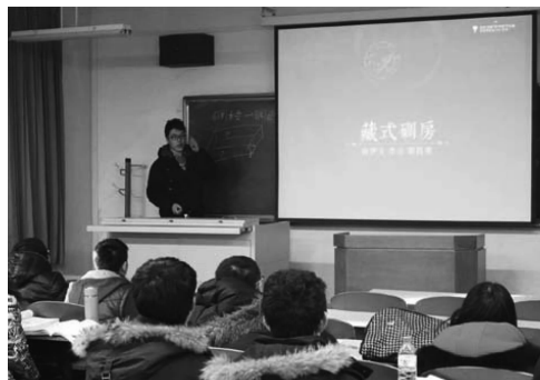
图2 学生作《中国传统民居》专题汇报

安排学生课下研习、课上汇报,让学生真正成为课堂的“主角”。例如:在中国传统民居部分,根据知识点及内容特征分若干专题,教师提前将相关书籍、网站向学生推介,布置学生在课下做功课,课上进行分组汇报(图2)。在汇报过程中,可随机提问,互评讨论,教师也可现场指导,最后进行总结点评。这种以讨论为主的学习方式,让学生真切体会到了“教”与“学”的乐趣,更能激发学习热情,活跃课堂气氛,学生在合作与竞争中不知不觉提升了学习表现,对于知识内容的理解也更深刻、充分。