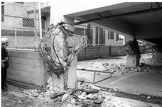
图1 某多层钢筋混凝土框架受地震作用的破坏情况