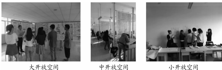
图2 适应建筑学专业“场效应”教学模式的场地

从传统的单一的封闭式专业设计教学空间向多元的开放式专业设计教学空间的转变。开放式教学空间的层次性:大开放的展厅空间(建筑面积约300平方米)(图2)。