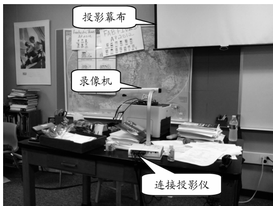
图2 美国教室手写投影教学法现场情况