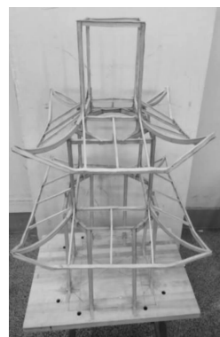
图6 组装完成的结构模型

在结构设计竞赛中,由三人组成一个团队参赛,各自根据自身的能力以及兴趣爱好分工明确,动手能力较强的主导模型制作,对计算机软件感兴趣的学习分析软件,语言功底强的负责结构计算书的撰写,分工中不乏合作,在比赛现场制作模型时,每个人按照分配好的任务制作模型的构件,然后一起合作组装模型。队员中无论哪一方遇到难题大家都一起讨论解决,遇到分歧及时沟通交流。例如:在为此结构设计竞赛准备过程中,我们偶尔会为了结构上的某个问题而争执,一个队友提议为了降低结构模型的质量而去掉某个构件,而另一个队友认为该构件对结构承载力增加非常必要,所以不能去掉。但是最终双方会静下来,一起讨论商量,请教指导教师,综合考虑然后做决定。所以面对矛盾,要学会沟通、协调,为共同的目标,让团队走得更远。当今的大学生多是独生子女,难免由于个性而在团队中产生矛盾与分歧,而结构设计竞赛正是让大家从团队利益出发,学会协商,学会合作,从而培养了学生的团队协作能力。因此,结构设计竞赛在当代大学生团队协作能力的培养上有着举足轻重的作用。