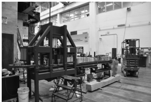
图2 UIUC 铁道中心枕轨试验系统