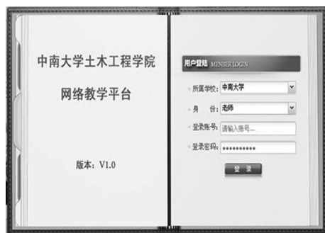
图3 中南大学土木工程学院网络教学平台

方面,由于设计资料的多样化,使学生的成果呈现出多样化的特征;另一方面,由于选题来源于实际工程,部分学生借助于网络地图工具,在原始设计资料的基础上,更清晰地了解当地的地形、地貌,道路、建筑分布情况,提交的成果更符合实际。