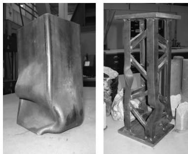
(a) 方钢管 (b) 格构式柱 图 1 钢短柱的失稳形态实验图

实际工程是钢结构设计原理课程的最佳教学资源,将国内外钢结构的代表性工程引入课堂实施案例教学,不仅可丰富教学内容,还可做到理论联系实际,使书本中枯燥的理论变得生动形象。工程案例根据教学目的可分为课堂引导案例、课堂讨论案例和课外思考案例。因此,将工程案例引入教学,需要根据教学内容、教学目的和教学进度而进行素材的合理编排和加工处理,使之符合课堂教学规律与特点。在教学过程中,工程案例可围绕一个或几个实际工程问题展开描述、分析与讨论,用以提高学生分析问题和解决问题的能力。课程还可利用课程网络平台共享国内外著名钢结构施工的纪录片和国内外钢结构倒塌事故的图片 and 调查,丰富了学生课内外内容。实践表明,采用案例式教学不仅拓展了教学内容,还活跃了课堂学习气氛,有利于学生将理论知识融入工程实践,培养学生的实践和创造能力。