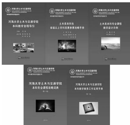
图1 河海大学土木类系列蓝皮书书影

土木类教学系列蓝皮书是为各类教学教务工作服务,为真正实现教师主导,学生主体的人才培养模式助力的全套土木类教学示范系列书籍(如图1)。