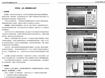
图4 本书教学设计示例片段展示

目前很多高校引进的博士人才往往一报道就承担教学任务,这种瞬间从学生到教师的角色转变,给年轻教师以挑战。如何帮助他们结合自身优势和特点尽快适应并融入教学工作中,成为专业建设的重要课题。