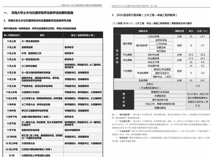
图3 重要教学活动节点图及培养方案导读图

该书不仅是一本学习指导书,一本生活咨询书,更是一本创新引导书,从学习到生活,从课内到课外,从入学到毕业,涉及大学生学习、生活的方方面面,较好地解答了学生的困惑,理清了学生的思路,明确了努力的方向。