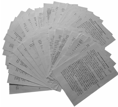
图2 部分学生问卷反馈情况展示

通过对“双主”特色人才培养模式的管理体系、教学模式、课程建设等方面的充分调研与分析,向全院四个年级,1 000余人发放问卷征求意见(如图2),从而有针对性地进行构思和撰写(如图2),再对相关环节中的优势经验予以整理与凝练,对存在的不足及时梳理、改进,最终得到可以编制入蓝皮书的内容。同时在项目的研究过程中,也将学院不断采用的最先进的培养做法形成管理办法和文件,纳入到蓝皮书的编制体系中。更为重要的是,在研制过程中,邀请了全院甚至全校,乃至全国土木行业中近50位优秀教师,以及河海大学土木与交通学院从2009级到2013级近100位本科菁英共同参与了丛书的编撰或审定,充分体现了“教师主导,学生主体”的人才培养模式的执行理念。