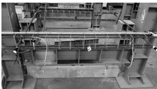
图2 完成绑扎后的钢筋骨架

34组钢筋骨架完成绑扎后统一进行混凝土浇筑,为减小混凝土的离散性,采用C20商品混凝土浇筑。学生派代表参与浇筑、振捣和抹面的全过程,以确保混凝土浇筑的质量。混凝土梁经过精心养护由学生完成梁侧面粉刷、划线、粘贴应变引伸仪测钉等准备工作,最后分批进行加载试验。