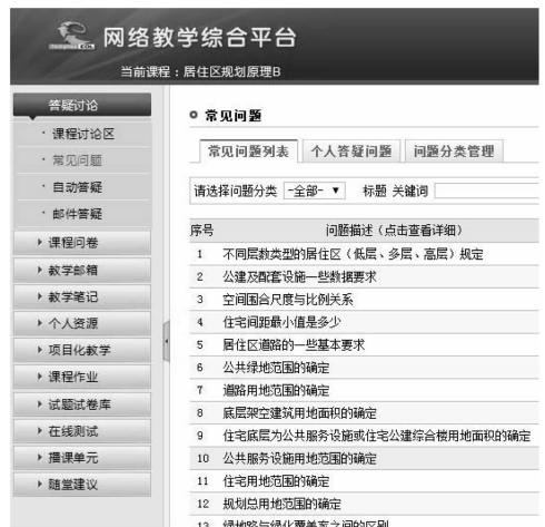
图1 网络教学平台在教学中的应用

信息化时代的到来与人民物质水平的提高,为多元化的教学提供了良好基础。借助于网络,利用电脑、手机作为课堂教学的补充辅助教学尤其适应当前的教学环境。如网络教学平台、微课、微信群、QQ群等。网络教学平台可以针对一些普适性问题(图1),以固定格式的模板来回应学生常见问题与困惑;对于一些用文字表述不清楚的问题,可采用微视频辅助网络教学来解决(图2);而微信群、QQ群则相对比较灵活(图3),可针对学生突发问题随时答疑。