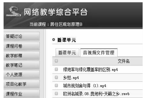
图2 网络教学平台与微视频结合在教学中的应用