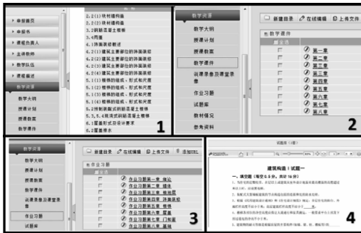
图3 青岛农业大学建筑构造课程建设情况

享,包括所有章节教学课件、30%教学视频、所有章节作业习题、两套试题、课程简介、教学大纲、参考教材和资料、课程评价、课程教学效果、课程附件等。通过课件、视频可预习、复习或自学该课程,习题和试题可检测个人学习效果。该平台还可实现教师和学生的互动。图3分别为教学视频、教学课件、作业习题和试题截图。