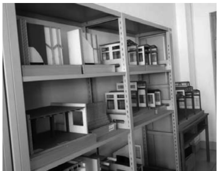
图1 青岛农大模型实验室用于教学的部分模型

建筑构造上册主要研究建筑物的各组成构件及其构造原理,借助图片、动画、建筑模型(如图1)进行认知学习。首先,通过视频动画将整栋建筑的构件组成进行解析,让学生构建一个完整的建筑体系概念;然后依次讲解基础、防潮层、散水、勒脚、墙体、窗台、楼地板、楼梯、梁、屋顶等建筑构件,针对不同构件布置相应的实践作业,包括随堂练习、课后抄绘以及其他作业,可以是课后实地观察实物并思考完成相关问题,也可以是查阅资料或观察思考后扩充实习内容,但应注意上课随机抽取学生检查其完成情况,可通过汇报、黑板小绘、课堂小测验等方式进行,这样有助于提高学生的自主学习能力,避免“上课走神,课后走人”的低效学习;最后,在各局部构件学习完成之后,要求学生对该学期正在进行的建筑设计作业平面图进行剖切,从地面设计到屋顶各部位局部构件设计,最终绘制完整的剖面图,通过文字进行各部位详细说明和课堂PPT汇报。通过对建筑的整体初步解析、局部详细讲解加实践练习、局部加整体设计三个阶段,实现了从教师讲授到学生自觉思考、学习和设计的过程。