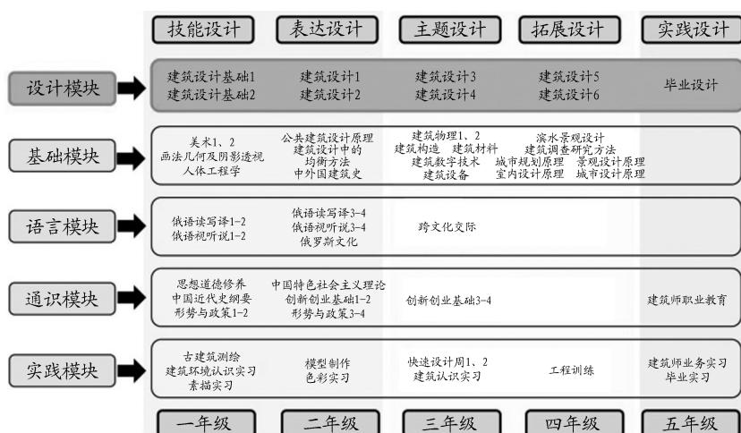
图2 乌拉尔学院建筑学模块化课程体系构成图