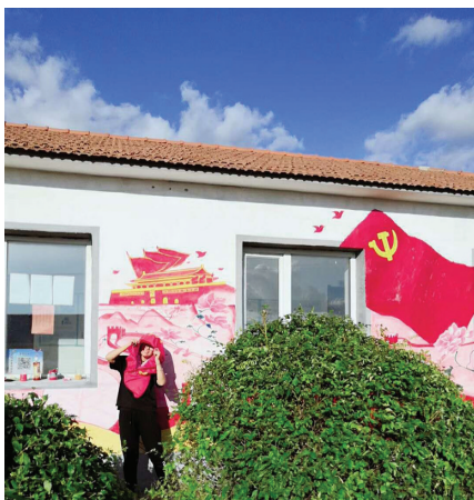
图3 2018年开原市城东镇孟家村村部绘制宣传墙