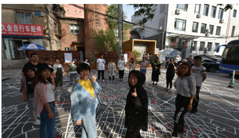
图5 参加沈阳创意设计周——地面绘制沈阳市锅炉房地图

我们参与了“沈阳市第二届创意设计周”刘鸿典建筑博物馆分会场活动——海口街道地面地图行为艺术,该活动得到了政府、附近居民和相关人士的关注,为沈阳的工业文化传承与发展起到了推动作用(图5)。