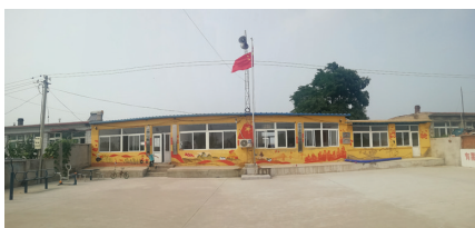
图4 2019年凌海市大业镇坨子村绘制宣传墙