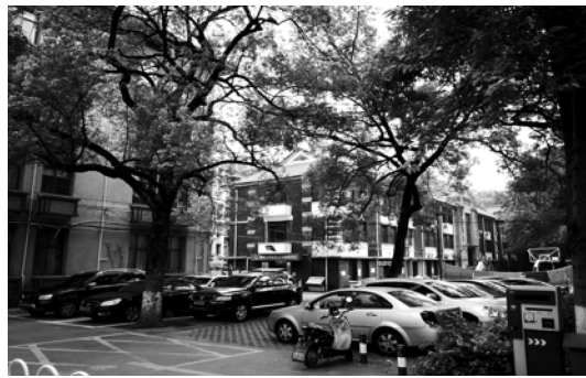
图 3 传统落后水刷石工艺与清水墙建筑效果对比图

湖南大学前进教学楼为四层框架结构教学楼,建于 20 世纪 90 年代,位于场地西北方向,与黄善言先生设计的教学中楼清水墙建筑距离不过 30 米,建筑立面采用白色条形釉面瓷砖,且采用竖贴方式。这与建于其后,位于其东的工商管理学院大楼仿红砖工艺饰面形成鲜明对比(见图 4)。