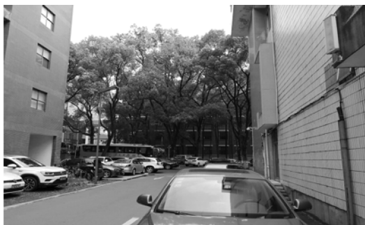
图 4 瓷砖饰面工艺效果对比图

为延续学校整体建筑风格,建法学院大楼采用以“石”为主题的建筑方案。为满足大楼大空间会议室、报告厅等功能要求,采用框架结构形式,框架建筑主体由柔性的钢筋混凝土框架和刚性的砖砌体填充墙两部分构成。虽然其框架梁、板、柱采用清水混凝土,但是因为要满足抗震及变形要求,其填充墙体的构造柱及填充墙的砌筑工艺不适宜采用清水墙形式,只能在饰面装饰工艺上做文章,采用清水混凝土与饰面材料的组合表达以“石”为主题的建筑装饰方案。