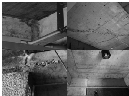
图5 清水混凝土表面缺陷图

建法学院大楼建筑方案因主题鲜明、设计创新顺利通过评审,并完成施工图设计、招标答疑、技术交底等工作,工程也如期开工。但是,当主体工程快完工时,建筑师现场检查发现混凝土梁板柱表面出现许多麻面、蜂窝、铁丝外露、缺棱掉角以及脱模后蝉缝杂乱无章等严重影响清水混凝土效果的问题,而且二层以上尤为严重。清水混凝土表面缺陷见图5。