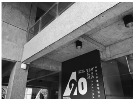
图7 报告厅混凝土涂漆-水刷石实景图