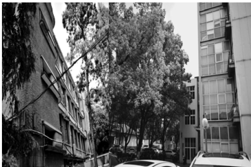
图 2 钢结构与清水砖石建筑效果对比图

湖南大学原学生六舍为四层砖混结构,位于场地北侧,与东向柳士英先生设计的老七舍三层清水墙建筑距离不过 10 米,虽然该建筑功能为学生宿舍,采用的也是砖混结构,但其没有沿用清水墙建筑风格,而是采用抹灰工艺,用干粘石、水刷石工艺饰面,因建于 20 世纪 80 年代初期,当时工艺技术相对落后,建筑立面效果不佳,已处于待拆计划之列。该建筑与相邻的清水墙建筑效果对比见图 3。