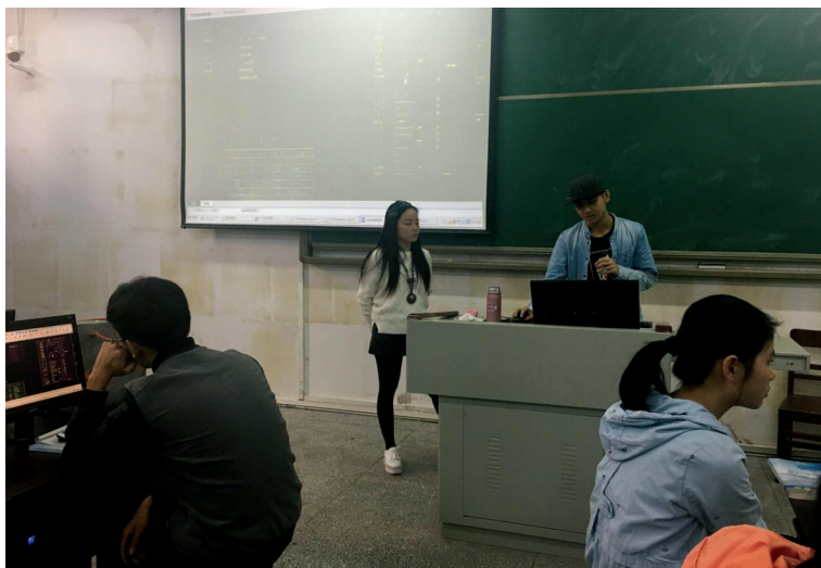
图2 全过程逆向教学法的课堂实训

各模块应统一采用同一个“样板工程项目”,先由教师按照“全过程逆向学习法”引领学生跟样实作;然后,再由教师督导,学生自主按照“顺向工作法”完成一个工程项目的计量(或再包括编制招标工程量清单)练习,使得学生具备企业初级职员的入职技能,从而为实现国务院印发《国家职业教育改革实施方案》(职教20条)中“产教融合、校企合作、工学结合、知行合一”四合要求奠定基础,学生实作见图2所示。