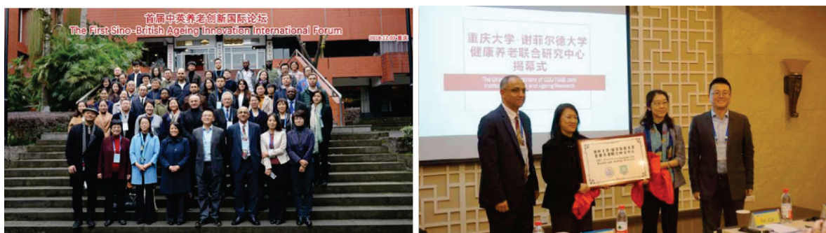
图 2 首届中英养老创新国际论坛

为培养学生的学术兴趣,营造开放互动和知识共享的学术交流平台,学院积极举办各类学术会议以推动学术交流,造就了良好的学术氛围。近年来学院已分别主办和承办了“山地人居环境可持续发展国际学术研讨会”“长江经济带景观与生态国际研讨会”“中英养老创新国际论坛”(图 2)等多个品牌国际会议,学术影响力辐射国内外,其中主办的“山地人居国际学术会议”是该领域第一个国际学术会议,进一步提高了学院的国际学术影响力。