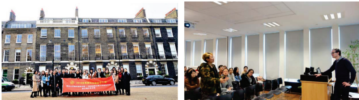
图3 全英建筑名校研学之旅

积极开拓寒暑期研学项目,丰富学生全球交流平台,拓展学生国际化视野。近年来与新加坡国立大学、英国伦敦大学学院、英国谢菲尔德大学、意大利米兰理工大学、西班牙马德里理工大学等高校合作寒暑期研学项目,如“全英建筑名校研学之旅”,由学院教师悉心筹备,将课堂知识讲授与场地实地调研相结合,建成了富有重庆大学特色的建筑全真课堂(图3)。