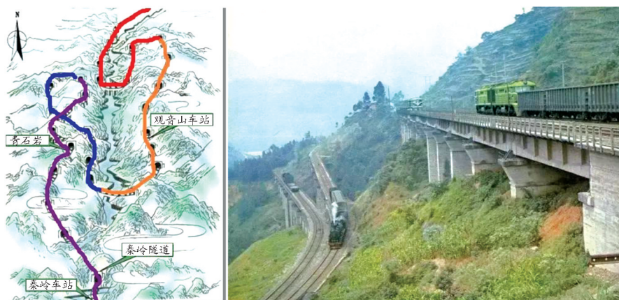
图 3 观音山展线示意图与观音山车站实拍

(2) 教学内容示例。2014 年,我国开始在南海进行填海造陆,仅用一年半时间就填出了 3200 英亩,并且在美济、渚碧、永暑岛三岛上建了飞机场,相当于在南海上建造了三艘不沉的航母,成功稳定了南海局面。现在,无论是西方操纵的国际法庭裁决还是自由巡航,都难以对南海局面造成威胁,填海造陆有效地捍卫了国家主权和海洋安全。