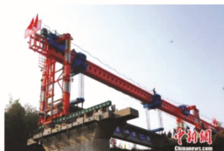
艰难困苦,玉汝于成