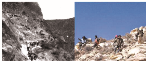
图2 大国工程之川藏铁路部分PPT展示