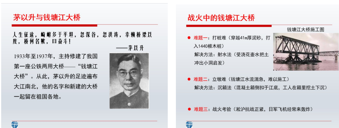
图1 茅以升与钱塘江大桥部分PPT展示

课程思政元素实施路径:(1)引入环节。借助钱塘江大桥案例引起学生的情感共鸣。“人生征途,崎岖多于平坦,忽深谷,忽洪涛,幸赖桥梁以度,桥何名歟,曰奋斗!”这是茅以升先生的名言。1933年至1937年,茅以升先生主持修建了我国第一座公铁两用大桥——钱塘江大桥。从此,茅以升先生的足迹遍布大江南北,他的名字和新建的大桥一起留在祖国各地;(2)展开环节。引入钱塘江大桥修建过程中发生的与基础工程有关的故事,讲述3个难题和解决方法;(3)结论环节。点出该故事所蕴含的爱国精神。以茅以升先生为首的我国桥梁工程界的先驱在钱塘江大桥建设中所显现的伟大的爱国主义精神,敢为人先的创新精神,永远是宝贵的精神财富。