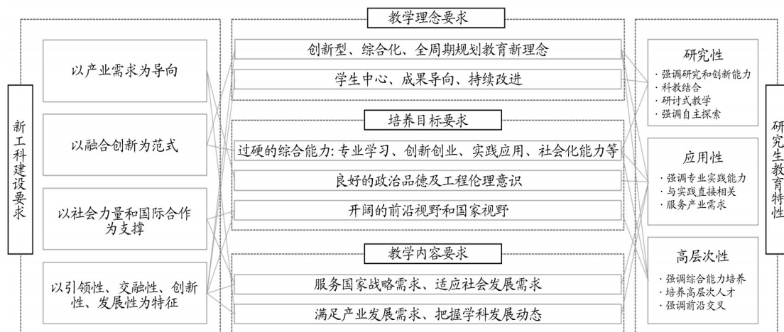
图 1 新工科背景下城乡规划学科研究生培养基本要求

根据质性文本分析结果,新工科背景下城乡规划学科研究生培养基本要求是重要内容之一,共有 38 篇文献(406 个编码参考点)涉及相关内容的讨论。结合新工科建设要求及研究生教育特性,相关研究重点从教学理念、培养目标和教学内容三方面提出要求(图 1)。