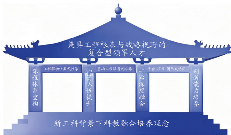
图3 新工科背景下建筑类高校拔尖创新人才培养模式架构

数字化、智能化、绿色化为建筑业的持续发展指明了方向。为培养适应新产业发展的拔尖创新人才,本文构建了基于工程根基的科教融合培养模式,厘清了其内在逻辑,如图3所示。首先,明确了新时代建筑类拔尖人才的定位为兼具工程根基与战略视野的复合型领军人才。其次,提出了以科教融合为核心理念的培养模式。通过跨学科重构课程和快速更新教学内容,将绿色建筑、智能建造、韧性防灾等前沿领域知识融入课程体系;通过建设“双师型”队伍和跨学科导师团队,提升教师的工程实践能力和科研创新能力;通过搭建未来技术学院、现代产业学院等新型平台,推动教学、科研和产业的深度融合;通过构建“思维—实践—评价”闭环机制,系统提升学生的创新素养。最后,总结了关键实施路径,包括任务驱动式教学、本博贯通培养,以及项目、团队、平台协同等,并借典型案例论证其有效性,为建筑类高校拔尖创新人才培养提供了从理念到实践的系统性解决方案。