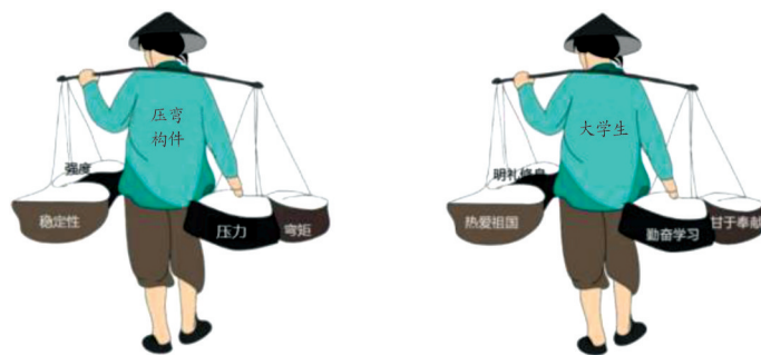
图2 压弯构件的担子与大学生的担当

专业学科知识源于实践,服务于实践。土木工程专业与生活密切相关,一方面,教师可创设问题情境,采用启发式教学;另一方面,可运用类比法,借助学生生活中熟悉的场景帮助学生理解专业知识。例如,通过有限元仿真动态呈现焊缝应力云图演变过程,可以清晰观察正面角焊缝、肢尖和肢背三者的受力关系。这种内力分配并非简单的荷载分割,本质上体现了构件间基于弹性本构关系的责任共担准则。再如,压弯构件要承受压力和弯矩,须满足强度与稳定要求。与之类似,大学生也肩负着多重责任,包括热爱祖国、明礼修身和勤奋学习等。作为国家的未来建设者,大学生应像压弯构件一样勇挑重担,如图2所示。