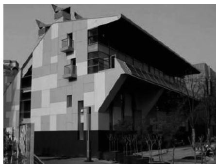
图3 南向墙遮阳板和太阳能光伏发电系统