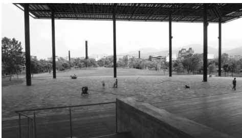
图4 棚架下的活动空间