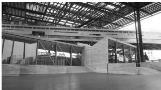
图2 罗东文化工场建筑棚架

地标性的摩天大楼印证着这一历史逻辑,就像上海的东方明珠、金茂大厦等一系列的建筑,想要在上俯瞰城市的壮丽景象,就得付出金钱的代价,这其中隐含了一些权利与建筑之间的内在逻辑。而对于一座城市的公共文化建筑,如果“行走”的自由被束缚,建筑的公共性必然也不复存在。在罗东文化工场中,自由“行走”的概念被灌输到了建筑的每个角落,人们可以通过建筑中高低起伏的路径而走向建筑的屋顶(图3),屋顶被开辟出来营造出一个全民都可自由登上的平台,在平台上可以自由俯瞰城市的风景。用黄声远自己的话来说,“这是一个让每个人都可以登上都市屋顶的礼物。”这么一个小小的改变,体现了建筑师为实现公共空间的平等享有权而付出的努力,也表达了建筑管理者的慷慨与社会责任感。而这种对公共空间权力的关注与努力,最终打造出了这座让市民具有归属感的公共建筑,就像有人所形容的,“这座建筑的存在更像一种陪伴。” [5] 陪伴着环境,陪伴着市民,陪伴着每个人的内心。从具体的操作手法来看,黄声远抓住了建筑空间中“行走”的两个维度。第一个维度是纵向的,就像上文中所提到的,人们可以通过不同的路径登到建筑的顶部,将具有权利象征性质的顶部空间解放给公众,这个维度的“行走”自由代表了一种空间的平等享有。第二个维度是横向的,罗东文化工场的建筑形态并没有像台湾寻常的文化中心那样以封闭的黑盒子形态呈现,无拒人于千里之外的感觉,而是以一个高达18米的开放棚架结构出现在场地之中,棚下是可供市民随时自由出入的公共生活空间(图4)。同时,建筑连通了周边的环境,市民可以从建筑下穿行通往自己想要到达的地方。通过这种处理手法,建筑在环境中不再是一个阻碍物,而是一个连通体,它的存在使周围环境的关系更加和谐。这种横向的“行走”自由使建筑融入环境之中,与环境发生关系。这样,建筑实则已经融入到周边市民的生活之中,市民的生活就在这里上演,这样的空间是具有剧情的空间(图5),生活的一幕幕都在这里发生,这样的空间才能真正融入到公共生活之中。