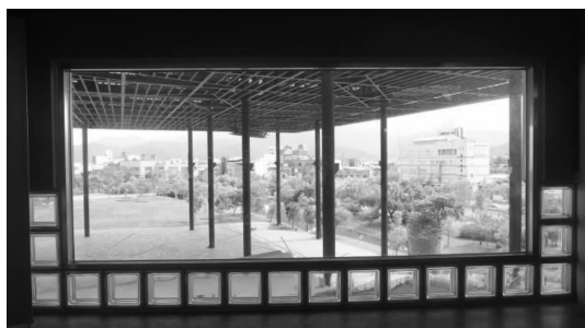
图7 城市肌理在空间中的留存

当一个新建筑产生,我们所思考的是它对这座城市的态度与这座城市给予的回应,这就如同一个异乡人来到陌生的城市落脚,与这座城市发生故事,一方面取决于他的包容性,另一方面取决于城市的包容性。罗东文化工场这座建筑对于罗东来说,就是一座外来物,在形态层面并没有对文脉做出过多的表达,但是内核却饱含着对罗东城市的情感,在此,可用一个“存”字来形容这种包容。罗东文化工场以高18 m,宽90 m×90 m的超级棚架形态出现在环境之中,但是棚架之下并不是实体的构筑物,而是将中段空间留白处理,留白的意义是透过城市原有的肌理可相互对望(图7),这种对望让城市的记忆在这里永久地流淌下去。建筑的存在没有削弱原有城市视觉秩序,反而有一份增强的意味。棚架本身的高度是以罗东“建蔽率时代”所修建的建筑都处于18 m高度的现状为参考设定的,这种“存”城市记忆于建筑之中的态度反过来使建筑有了一份“在”的真实,这份“在”是新旧建筑形体尺度的呼应,也是建筑空间所体现出来的人文关怀。新建筑相关于过去与未来,连接着这两个时间维度中的城市空间,既对过去的城市空间起着留存历史记忆的作用,又为新城市的活力积存着力量。