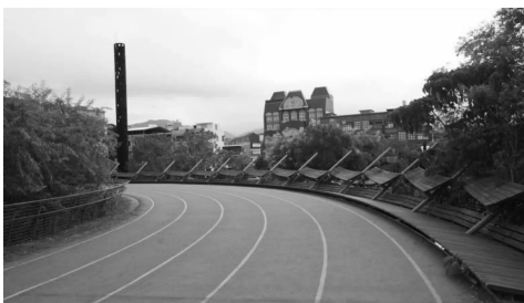
图6 场地南区附属运动公园

同样,黄声远还有将这种“行走”的内涵扩展到城市维度的野心,在十几年的宜兰营造中,他精心地在自己所设计的建筑之间营造着可以行走串联的空间。这些空间形式各异,但是都有一个共同的特征:鼓励人们用“行走”来体验城市的温度(图6)。他似乎是在默默为宜兰建立一个有机的城市人行交通网络,引导市民去发现城市、认识城市,产生城市归属感。这种归属感是建立在浓厚细腻的生活印象之上的,而这种“行走”恰好能让我们慢下来,安心体验这个城市的每个细节,感受到它存在的温度。