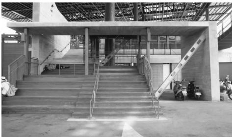
图5 供人使用的公共空间