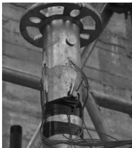
图2 测点处的应变片