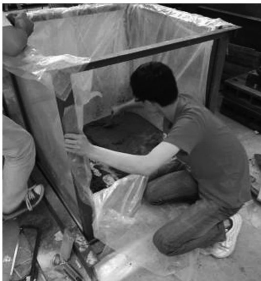
图3 学生在浇筑溶洞