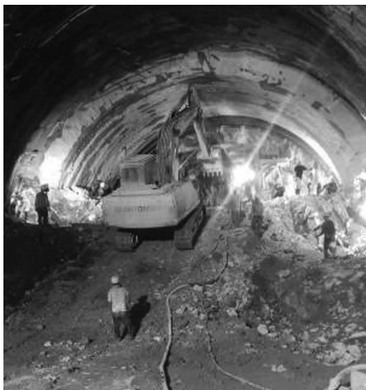
图 5 隧道施工现场实习