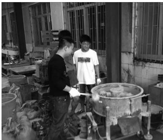
图1 学生在拌制模型材料

目前,在岩土工程系,部分教师开始尝试组建由导师、硕士生、本科生组成的科学研究小组,以教师在研课题为依托,形成研究梯队,产、学、研相结合,引导本科生尽早参与科研,通过1~2年的时间,完成部分试验研究工作,旨在培养学生分析问题、解决问题的能力。以笔者主持的课题为例,在研究岩溶区桩基的问题中,有两个内容由本科生完成:一是基岩材料的模拟;二是溶洞的浇筑。在基岩材料的模拟中,学生通过与导师及硕士生交流,了解岩溶的形成和材料性质,然后自己选择、购置不同的材料,进行室内模拟基岩材料的试验。通过多次尝试和改进,最终得到了理想的基岩模拟材料(如图1)。在溶洞浇筑中,有学生首先想到利用PVC管筑模,试验后发现,PVC管模不易取出,试验失败;而后选择泡沫铸模,试验效果较好,但造价高;最后学生想到了用石膏铸模,通过多次配比调整,石膏铸模不仅经济,而且试验效果好(如图2、图3)。通过该试验,充分发挥了每一名学生的积极性、主动性和创造性,让他们真正尝到了成功的喜悦。与此同时,试验中学生把已取得的科研成果融入课堂教学,大大丰富了课堂教学内容,激发了学生的创新热情,增强了学生对科学研究的兴趣和独立解决科学问题的能力。