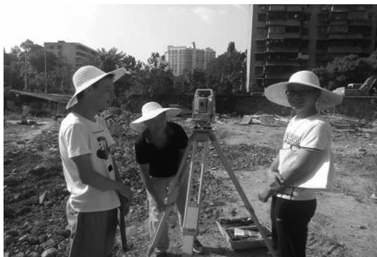
图 4 施工放样现场实习

生产+毕业实习结束后,采用综合评定模式对学生实习成绩进行评定,其中实习报告评定成绩占 70%,答辩成绩占 30%。通过实习,学生对土木工程行业的运作模式、设计、施工、监理、业主各方的关系及工作内容有了初步认识,对协调社会人际关系有了切身体会,基本学会了 PPT 制作和资料的收集整理,对施工安全和施工安排有了更深的体会。从实习答辩情况来看,学生基本能应用专业知识及有关基础知识解决专业技术问题,提高了社会实践能力。部分学生现场毕业实习如图 4-6。