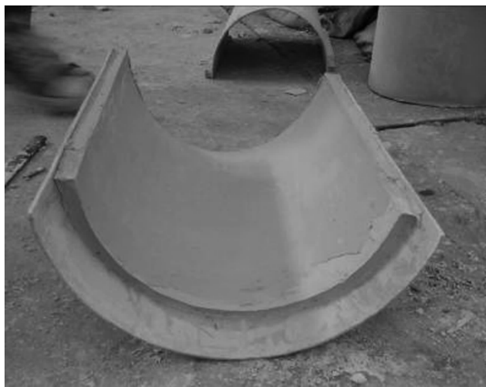
图2 学生设计的溶洞浇筑模板