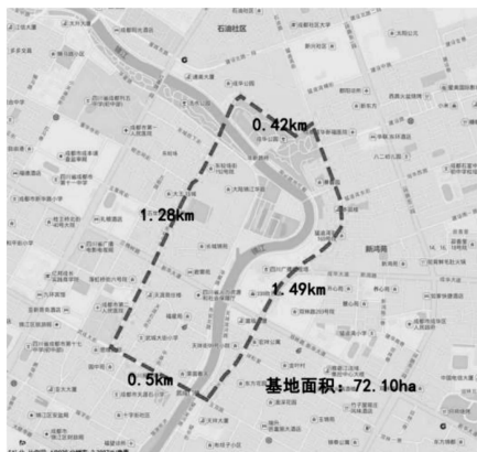
图2 研究范围-街道地图 图片制作:邹林芸 张继刚