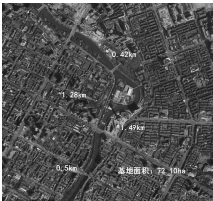
图1 研究范围-卫星地图 图片制作:邹林芸 张继刚

一般而言,独立学科的设立基础多源自相近学科的交叉融合,独立学科体系的完善需要其他学科知识的补充与论证 [1] ,多学科交叉研究的互动式教学更有利于带来学科发展的创新机会。该届联合毕业设计竞赛,致力于探索教育方式由单学科纵向发展向多学科横向互动转变,与此同时,进一步思考和探讨人居环境营造由大尺度转向精细化设计 [2] ,以及工业文明从单重效率向兼顾生态文明转型 [3] ,为此最终选取以“诗意栖居,都市效率”为题 [4] ,并经反复比对,选择了成都市繁华核心地区近旁一汇集城市标志物、新旧住区、河道、商业等功能的滨水河湾地段(图1、2)为设计对象,结合规划、景观和建筑三大学科,从宏观、中观、微观三个层次不同维度对场地进行分析 [5] ,引导学生思考和权衡“诗意栖居”与“都市效率”之间的矛盾冲突与协同共生关系,结合三个学科的方案构思和设计创作,探讨成都市新时期发挥自身地域人居智慧特点的“安居”策略和创新路径,以及成都市地域性特点的人居环境营建手法 [6] 。