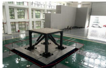
多功能地震模拟试验系统

按照该规划方案,实验室在2013—2018年建成了多功能地震模拟试验系统和山地岩土工程综合试验系统(图1),配套建设振动台实验楼、岩土实验楼等实验场地3800m 2 ,显著提升了实验室开展山地岩土工程和山地土木工程防灾减灾领域重大基础研究的能力。