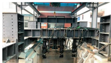
山地岩土工程综合试验系统