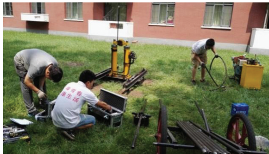
图1 基于静力触探技术的校园内地层勘探实训

实验室开放是工程学科人才培养的重要途径 [7] 。对于大型科研实验项目,实验室集中组织同学进行有序参观,并安排部分同学参与简易操作。对于重点实验室中易损、昂贵仪器的使用和操作,会定时、定期地组织设备管理人员进行现场演示,使本科生有机会了解、使用先进的仪器与设备,扩充学生的知识视野和提高专业实践能力,有效促进大学生积极申报各级各类的大学生创新和创业项目。基于实验室开放式管理制度,学生可根据需求在周末和节假日到这些开放实验室进行实验练习和科研探索,在教师的指导下完成大学生课外科技创新项目,或直接参与指导教师的各类科研项目研究中。此外,实验室还积极探索了一些开放性实验项目,例如土力学实验室借助2015年购置的进口无绳静力触探设备,开设了基于静力触探技术的校园内地层勘探实训,如图1所示。