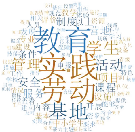
图 1 劳动教育实践基地评定标准的词云图谱

从评定标准政策文件的词语云图谱显示来看,所列 7 省的评定标准紧紧围绕劳动教育实践基地的核心展开,重视活动、管理、课程、安全等方面的宏观要素。