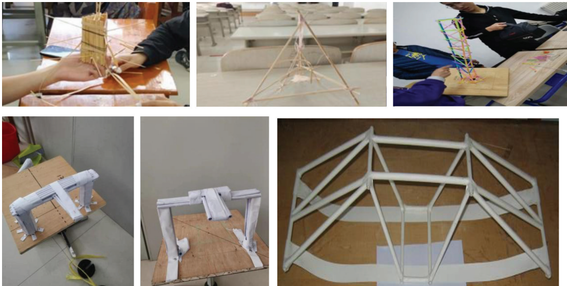
图2 “高空护蛋力学实践活动”“纸质结构设计大赛”“吸管结构设计大赛”

教师苦练教学基本功,研究线上线下等多种教学模式,并将成果应用于本科理论课程教学与实践教学环节;在众多产学研基地中选拔企业骨干进入教师团队,吉林大学土木工程专业的认识实习、教学实习、生产实习、工程造价、工程造价课程设计、毕业设计等均聘请合作企业的技术骨干承担部分教学任务,通过讲课、讲座、实践教学等方式增强学生理论联系实际的能力,促进工程型人才 and 学术型人才在学术思维和工程应用理念等方面的交叉渗透。